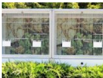
Panoramabox 109x50x54 cm mit LED-Beleuchtung und